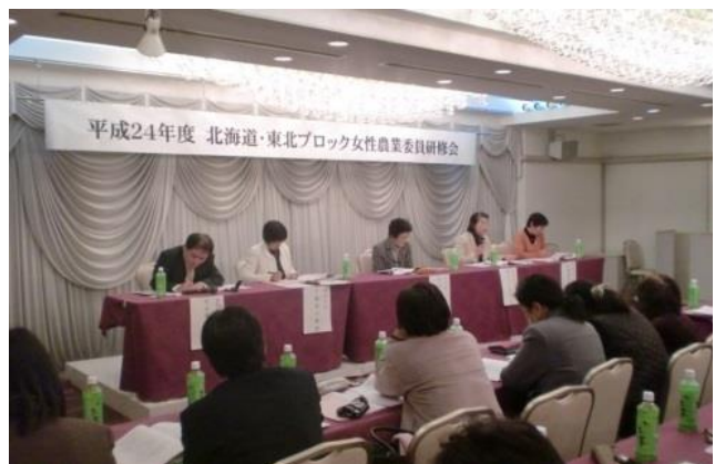
平成24年度北海道・東北ブロック女性農業委員研修会（平成25年1月17日・宮城県仙台市）