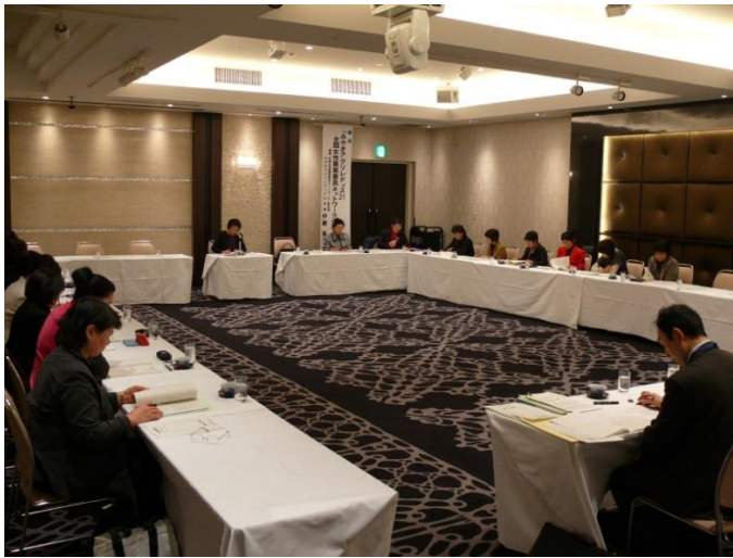
県内の女性農業委員が参加した研修会(平成25年1月29日)