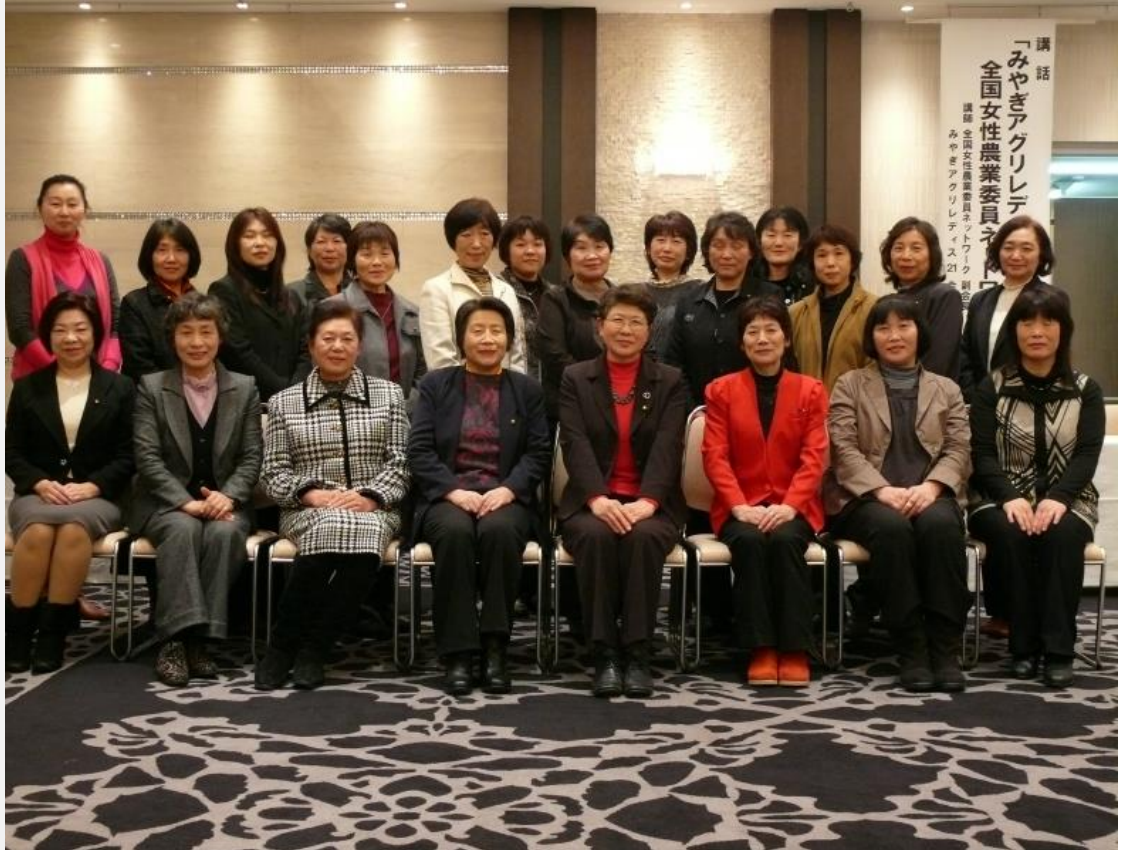
秋田県女性農業委員協議会会員(平成25年1月29日、第6回総会)